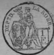
TABLE ALPHABÉTIQUE des Actes de mariage de la mairie de Dülken pour l'an 1814 dressée en exécution du décret impérial du 20 juillet 1807.