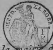
TABLE ALPHABÉTIQUE des Actes de mariages de la mairie de Dülken pour l'an 1813 dressée en exécution du décret impérial du 20 juillet 1807.