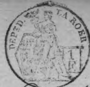
TABLE ALPHABÉTIQUE des Actes des mariages de la mairie de Dulken pour l'an 1810 dressée en exécution du décret impérial du 20 juillet 1807.