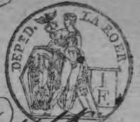
TABLE ALPHABÉTIQUE des Actes de mariages de la mairie de Ditton pour l'an 1809 dressée en exécution du décret impérial du 20 juillet 1807.