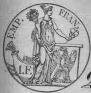
Table alphabétique des actes de Mariage de la mairie de Dülken pour l'an 1808, dressé en Ex or ou Duct impal du 20 juillet 1807