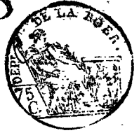
TABLE ALPHABÉTIQUE des Actes des naissances de la mairie d'Halldenkirchen pour l'an 1810. dressée en exécution du décret impérial du 20 juillet 1807.