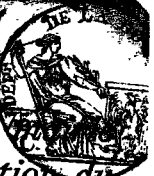
TABLE ALPHABÉTIQUE des Actes de naissance de la de Haldenkirchen, pour l'an 1809. dressée en exécution du décret impérial du 20 juillet 1807.