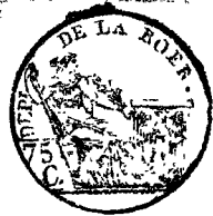
TABLE ALPHABÉTIQUE des Actes des naissances de la mairie de Waldenruechen pour l'an 1811. dressée en exécution du décret impérial du 20 juillet 1807.